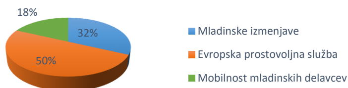
Graf 1: Delež odobrenih aktivnosti v KU1 na tretjem prijavnem roku

Med sprejetimi aktivnostmi je bila povprečna vrednost mladinske izmenjave 10.045 evrov, evropske prostovoljne službe 12.114 evrov in mobilnosti mladinskih delavcev 7.974 evrov. V primerjavi z letom 2014 je povprečna vrednost mladinske izmenjave padla za 29 % oz. za 2.864 evrov, povprečna vrednost evropske prostovoljne službe je padla za 10 % oz. 1.214 evrov, povprečna vrednost aktivnosti mobilnosti mladinskih delavcev pa je narasla za 10 % oz. 726 evrov.