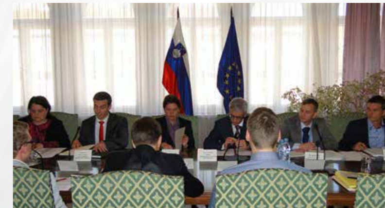
Seja Sveta Vlade RS za mladino ob prisotnosti predsednice vlade Alenke Bratušek, oktober 2013.