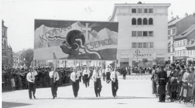
Kongres Kristusa Kralja, kovinarji iz Jesenic, Ljubljana, 1939.