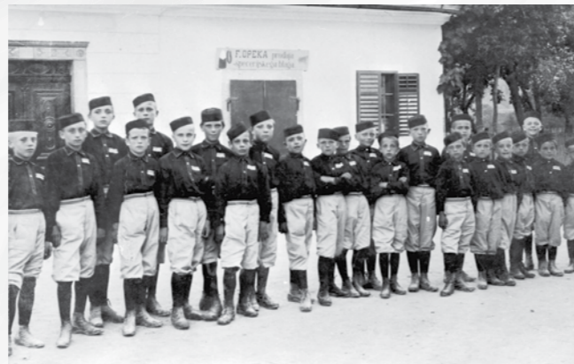
Mladi sokoli med obema vojnama. Hrani MNZS.

Študentska organiziranost se predvsem veže na posamezne univerze, kjer delujejo strokovne študentske organizacije po posameznih fakultetah in klubi oziroma organizacije študentov, ki se povezujejo na podlagi svetovnonazorskih opredelitev. Med organizacijami študentov na vsejugoslovanski ravni zagotovo velja omeniti SKOJ na eni strani, na drugi pa Organizacijo nacionalnih študentov (ORNAS 11 ), ki deluje v sestavi Orjune 12 . Sama Orjuna pa se je razvila iz Jugoslovanske napredne nacionalistične mladine (JNNO).