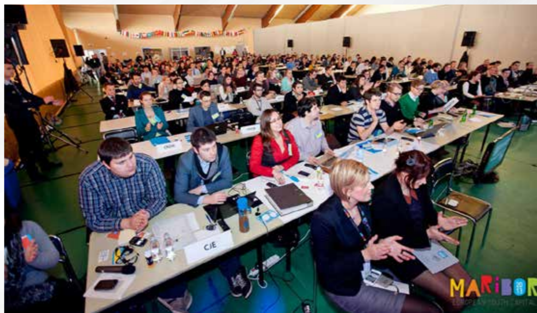
Generalna skupščina Evropskega mladinskega foruma, Maribor, 2012; Vir: MSS.