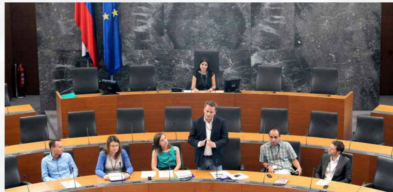
Dialog mladih, projekt Mreže Mama, državni zbor 2011.