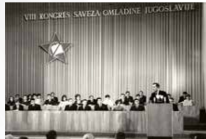
VIII Kongres Zveze mladine Jugoslavije, 1968, Vir: MLJ.

Organizacijska struktura ZSMJ je imela vertikalno in horizontalno dimenzijo. Vertikalna linija organiziranosti je izhajala iz osnovnih organizacij v šolah, podjetjih, zavodih in na ravni krajevnih skupnosti ter v nadaljevanju sledila hierarhični organiziranosti družbenopolitičnih skupnosti, od občinske organizacije, preko republiške do zvezne organizacije. Horizontalno dimenzijo so od leta 1974 predstavljale organizacije, ki so bile kolektivne članice ZSMJ in republiških organizacij Zveze socialistične mladine.