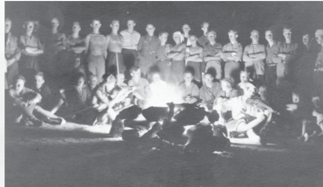
Skavti na taboru v Omišlju, večerni taborni ogenj.