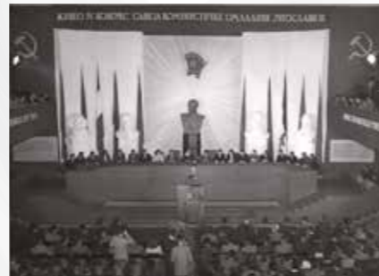
IV Kongres Skoja, 1948, za govorniškimi odrom Milovan Đilas.