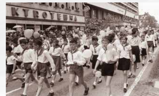
Pionirji na prvomajski »paradi«, Ljubljana 1961.