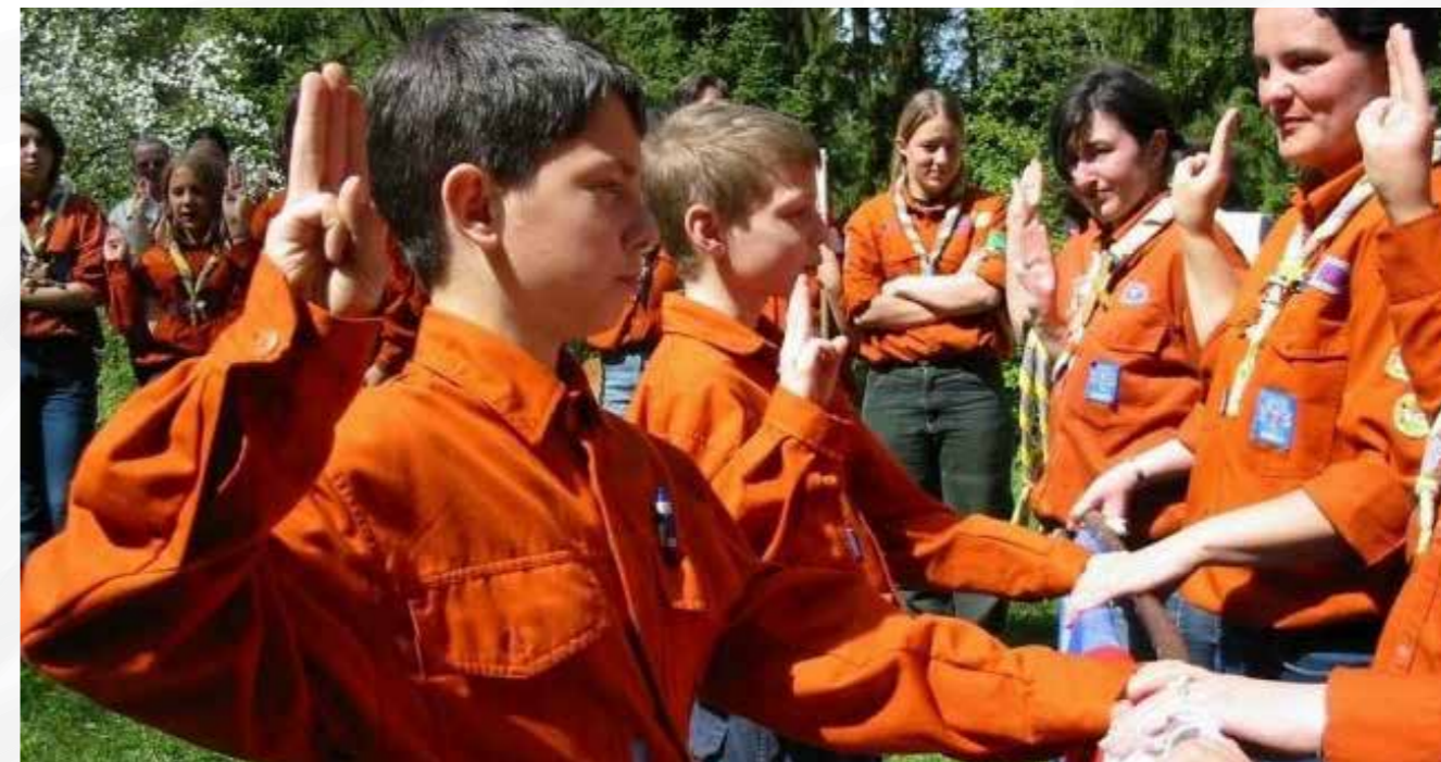
Skavtska obljava, ZSKSS.