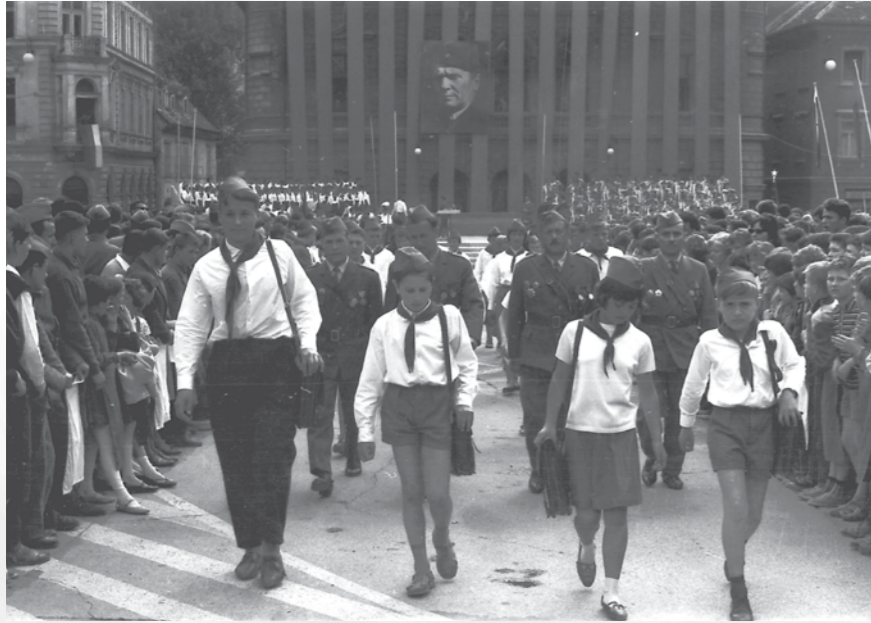
Kurirčkova torbica, Ljubljana, 1964. Hrani MNZS.