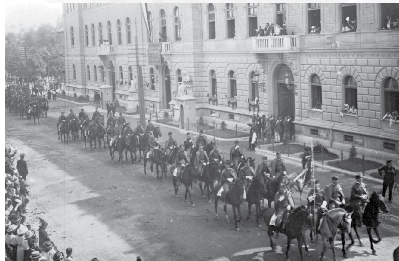
Sokolska konjenica na Vsejugoslovanskem sokolskem izletu, Lj, 1922.