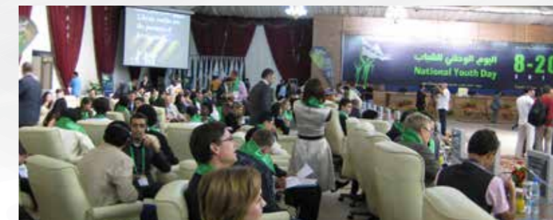
MSS je sodeloval tudi na obeležitvi mednarodnega mladinskega dneva v Libiji, 2010, Vir: MSS.