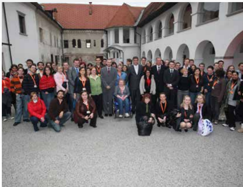
Dr. Milan Zver, minister za mladino v času slovenskega predsedovanja Svetu EU in evropski komisar Jan Figel ob Mladinskem dogodku, aprila 2008.

spodbuditev ideološkega organiziranja študentov in skupna platforma različnih prostovoljnih študentskih organizacij – boljše glede na preteklost v Sloveniji in njen demokratični razvoj. Slednje, vsaj ko gre za splošna politična predstavništva študentov v Evropi, je mnogo bolj pogosta praksa kot današnja slovenska ureditev. V tem primeru bi bil današnji ŠOS sestavljen iz prostovoljnih študentskih združenj različnih družbenih in političnih usmeritev.