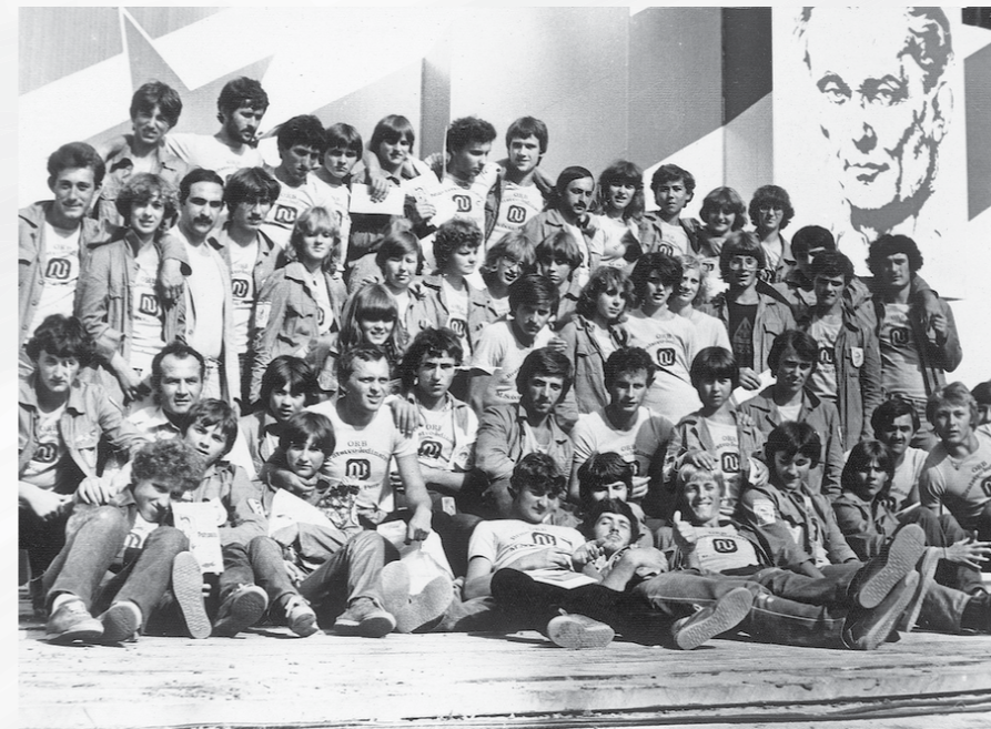
Brigadirji iz Murske sobote in Paračina, 1980, vir: arhiv brigadirjev