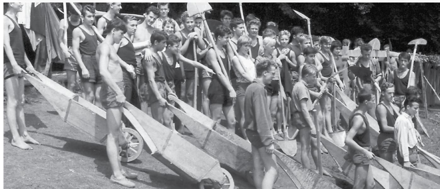
Mladske delovne brigade, cesta na Trojane 1957.