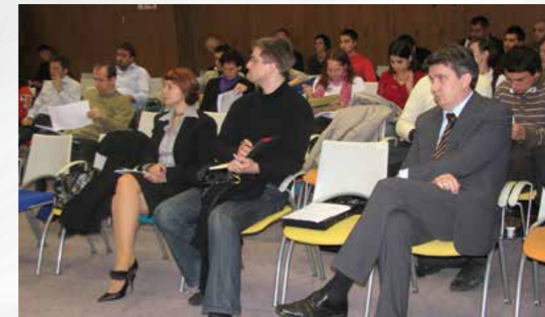
Razprava o Oblikovanju Sveta Vlade RS za mladino, Ljubljana, 2009, Vir: MSS.