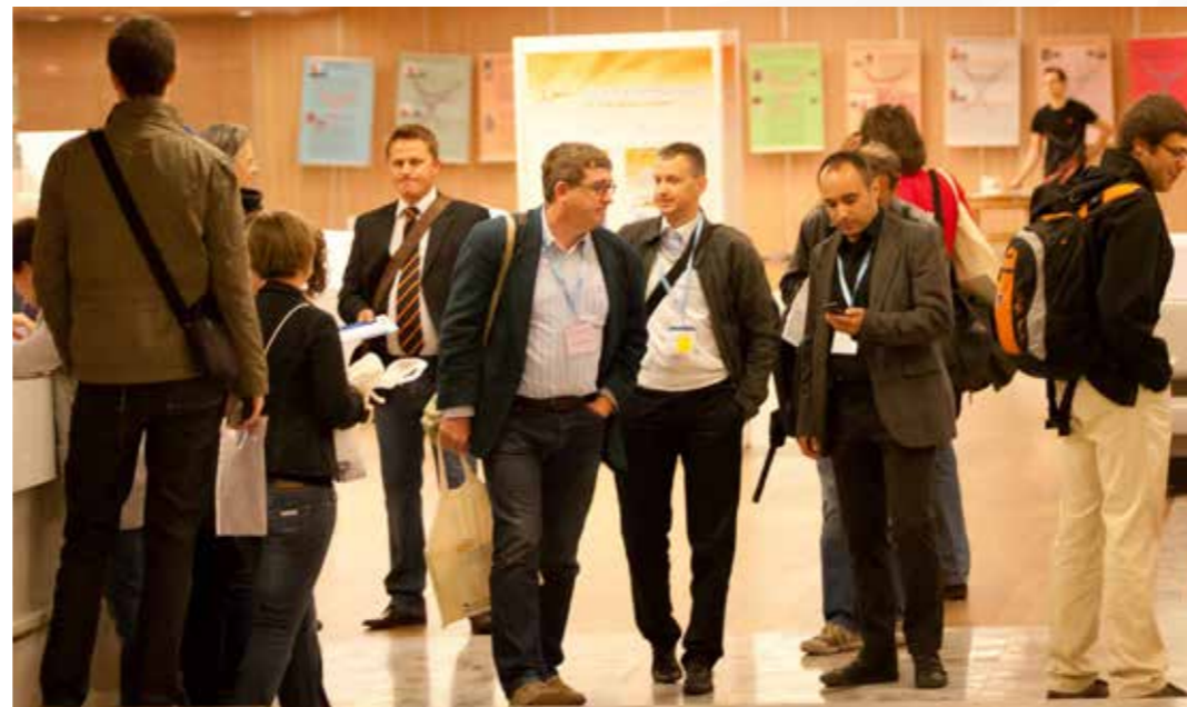
Ključna konferenca mladih, Ljubljana, 2012.

Sicer pa je sestavni del nacionalnega programa tudi vključevanje v mednarodno sodelovanje na področju mladine, še posebej pa razvoj mednarodnega mladinskega dela in učnih mobilnosti v mladinskem delu, v katerem ima MOVIT posebno mesto.