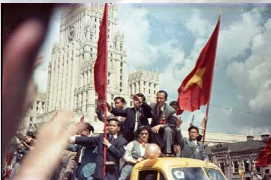
Severnovietnamska delegacija na Svetovnem festivalu mladine in študentov, Moskva 1957.

škem komunističnem voditelju. Delovanje pionirske organizacije se je vezalo predvsem na šolski sistem, zato je bilo kljub načeloma prostovoljnemu članstvu težko ne biti član. Bistvo NDR z vidika vzgoje mladine je bil socialistični pogled na svet, ki je povezoval razpoloženje naroda s stopnjo vključevanja mladih v režimske organizacije in s tem z izražanjem podpore obstoju in politiki NDR.