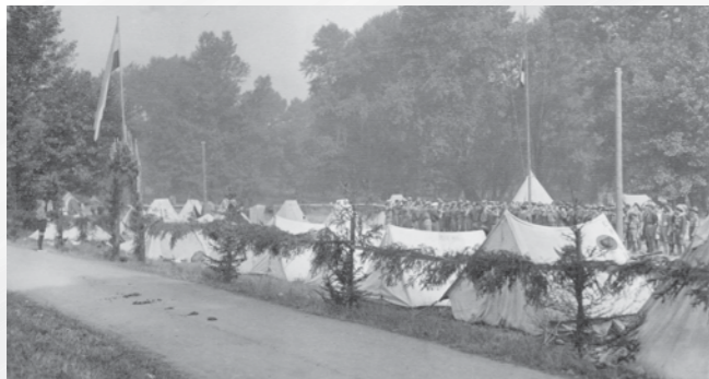
Tabor jugoslovanskih skavtov v pragi med obema vojnama. Hrani MNZS.