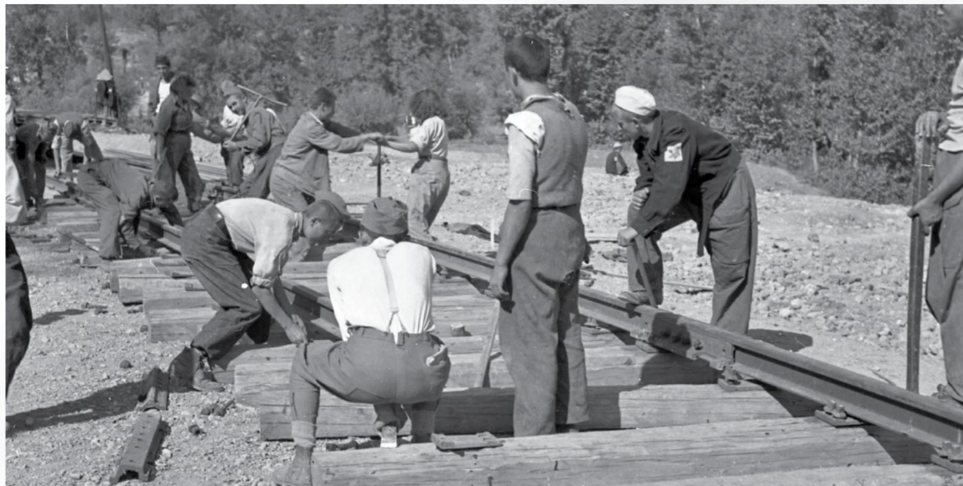
Gradnja proge Brčko Banoviči, september 1946.