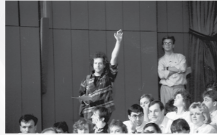
Zadnji kongres ZSMS, Portorož, 1989.