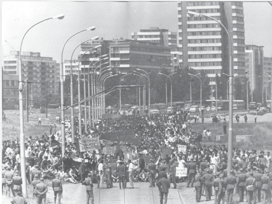
Kurirčkova torbica, Ljubljana, 1964. Hrani MNZS.