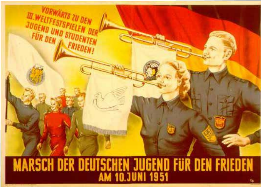
FDJ propagandni letak iz leta 1951.