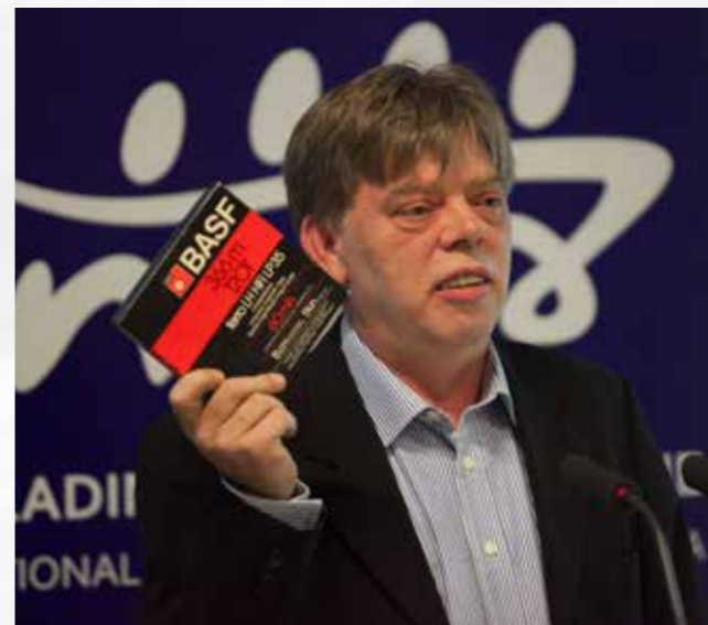
Posnetek z zvočnim zapisom Ustanovnega zbora MSS 25. aprila 1990