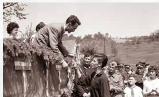
Republiška štafeta mladosti je krenila iz Šentilja, mimo Pesnice in skozi Košake do Maribora, maj 1961.