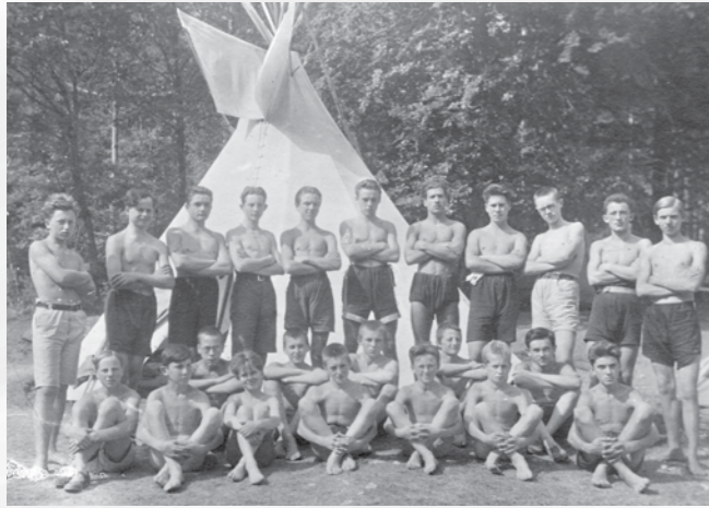
Skavti iz Maribora, udeleženci tabora v Završnici med obema vojnama.