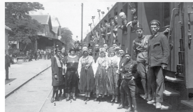
Orjunaši iz Slovenije na poti v Beograd, 1925.