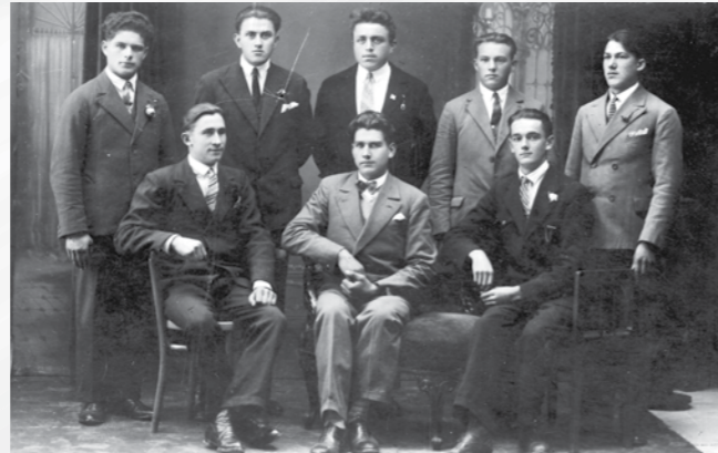
Odbor Krščanskosocialističnega akademskega kluba »Borba«. Hrani MNZS.