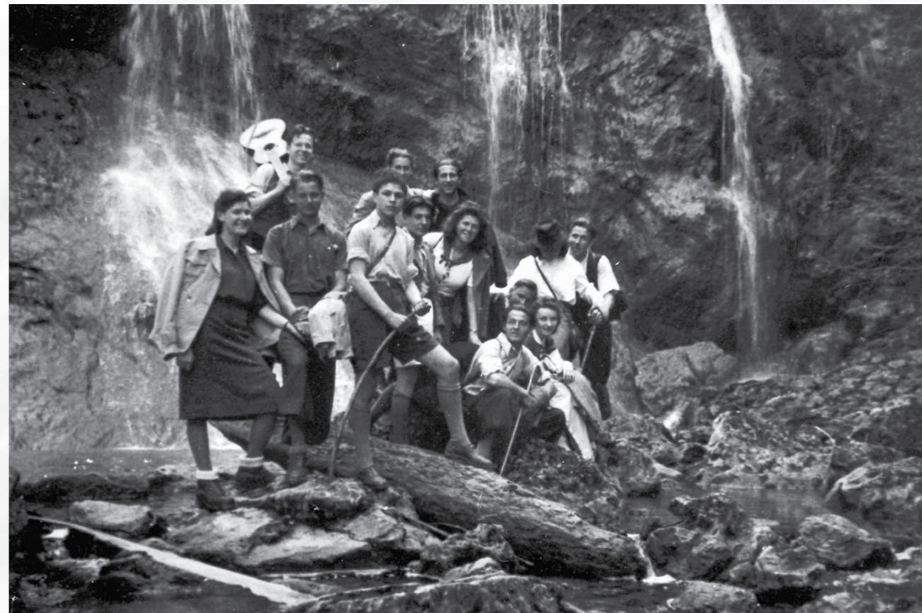
Ljubljanski Skojevci na izletu, pomlad 1941.