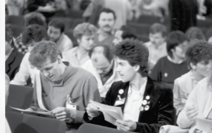
Kongres ZSMS, Krško, 1986, Foto: Nace Bizilj. Hrani MNZS.